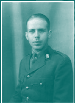
Hedendaagse portretten van Belgische verzetsmensen, gemaakt door de Franse fotograaf Jean-Marc Gourdon, gaan gepaard met historische foto's en persoonlijke verhalen van deze zogenaamde 'weerstanders'.