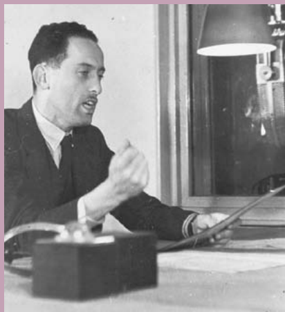
Loe de Jong spreekt voor Radio Oranje.