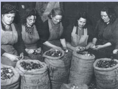
Het pellen van tulpenbollen voor de gaarkeuken in Rotterdam.