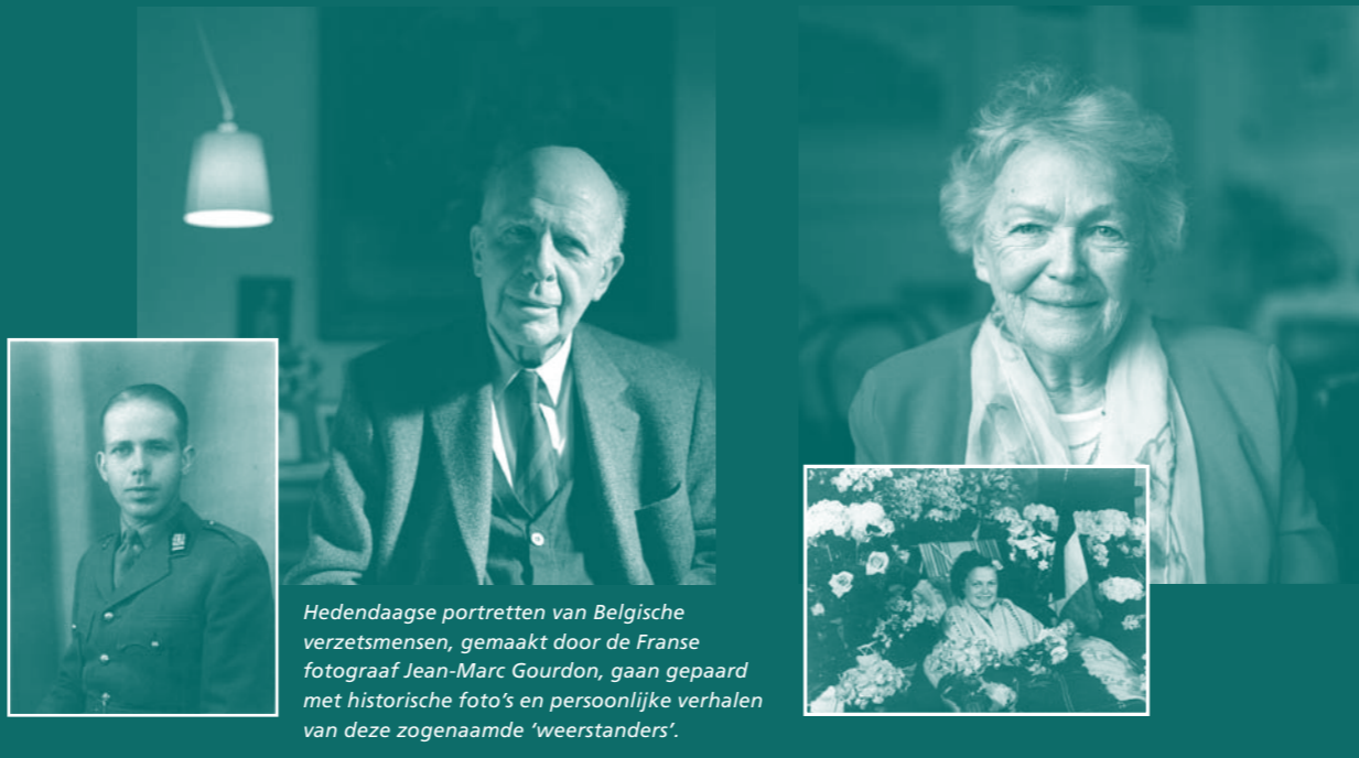
Hedendaagse portretten van Belgische verzetsmensen, gemaakt door de Franse fotograaf Jean-Marc Gourdon, gaan gepaard met historische foto's en persoonlijke verhalen van deze zogenaamde 'weerstanders'.