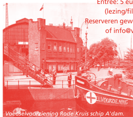
Voedselvoorziening Rode Kruis schip A'dam.

Aanvang: 11.00 uur Entree: 5 euro / vrienden gratis (lezing/film/museumentree). Reserveren gewenst: 020 620 25 35 of info@verzetmuseum.org