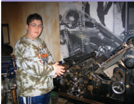
Leerling bij de illegale pers

Rian vertelt: 'Het kindermuseum begint met een 'tijdmachine' - een verrassende manier om van het nu naar de oorlogstijd te komen. Vervolgens belanden de kinderen niet in een traditionele tentoonstelling, maar in een samenhangende omgeving: een andere wereld; een plek ergens in Nederland. Bijvoorbeeld een plein met huizen, een winkel, een bioscoop en een station. Sommige deuren zijn dicht, andere staan open. In de lucht komen ieder half uur vliegtuigen over met een lichtbrommend geluid. Als je rondloopt zijn er overal ramen, inkijsjes en deuren die wel of niet opengaan. Je belt aan, de deur gaat open en je komt in een kleine ruimte, zonder dat je weet wat je te wachten staat.'