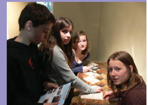
Leerlingen vergelijken persoonsbewijzen in de huidige vaste opstelling

Het kindermuseum bevat vier hoofdruimtes/huizen, waar de nadruk ligt op verschillende perspectieven: dat van aanpassing en het leven dat doorgaat (de toeschouwer), vervolging (het slachtoffer), collaboratie (de dader) en het verzet. Iedere hoofdruimte heeft een introductie die voor verschillende doeleinden kan worden gebruikt (het geven van historische context of het prikkelen van de nieuwsgierigheid door een opdracht). Iedere ruimte heeft een eigen sfeer; in iedere ruimte staat een vraag, dilemma en/of keuze centraal en iedere ruimte heeft een bijzondere centrale activiteit.