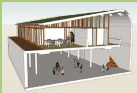
Schets van het kindermuseum ontworpen door architect Hans Ruijsseenaars.

"Het gebouw is nu tot in de kleinste details ontworpen. Het was heel leuk om daaraan te werken. De samenwerking met architect Hans Ruijsseenaars en zijn mensen is heel prettig verlopen. Het is heel mooi geworden. De architect vond het belangrijk dat er na de lange daglichtloze route door het museum een 'lichtmoment' is bij binnenkomst in het kindermuseum. De verdieping – met de ontvangstruimte voor groepen, kantoren en ruimte voor de museumdocenten – is sowieso heel licht door glaswanden en bovenlichten. Het dak wordt begroeid."