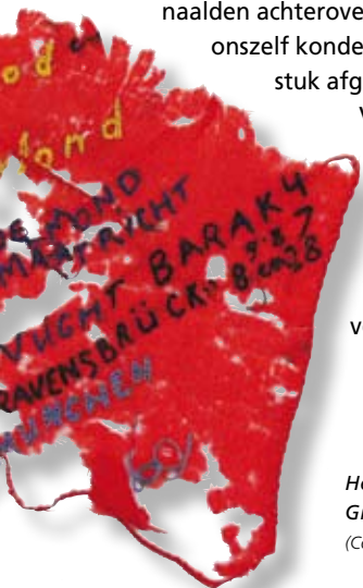
Het zakdoekje van Grada van Horen.

Voor het leven in gevangenschap werd in het Oranjehotel afgebeeld, soms in hele beeldverhalen.