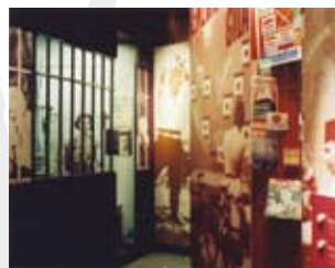
In 2005 breidde het museum uit met een speciale afdeling over Nederlands-Indie.