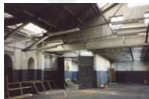
Een leeg Gebouw Plancius, vóór de verbouwing tot Verzetsmuseum (1999).

de samenhang tussen vorm en inhoud één van de meest geslaagde ooit, omdat vormgever Jowa het voor elkaar kreeg om over de smalle vrouwengalerij in de Lekstraat een rondgang te creëren waar bezoekers de zuidelijk route van een Engelandvaarder echt konden volgen."