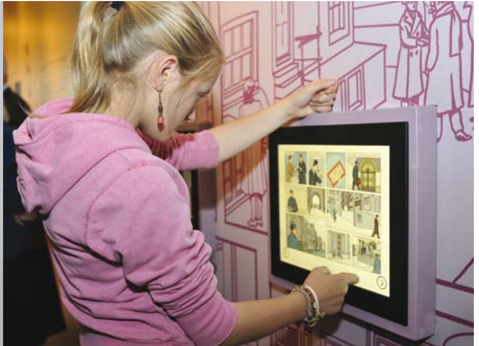
Meisje bij een multimediale opstelling in de expositie Wally van Hall.