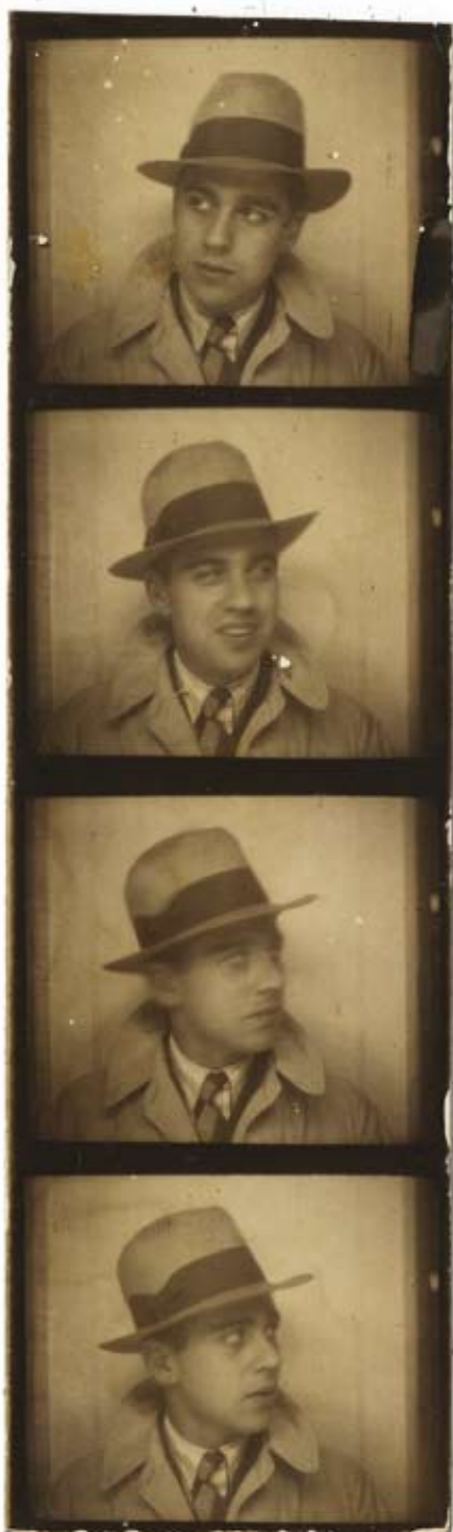
Wally van Hall