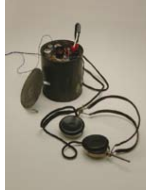
Radio-ontvanger vermomd als conservenblik

Na het illegaal beluisteren van Radio Oranje werd het blik weggezet in de voorraadkast. Wel met de afgesloten kant boven, zodat het niet opviel tussen