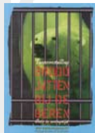
Brood jatten bij de beren. Artis in oorlogstijd was de best lopende wiselententoonstelling in de geschiedenis van het museum.