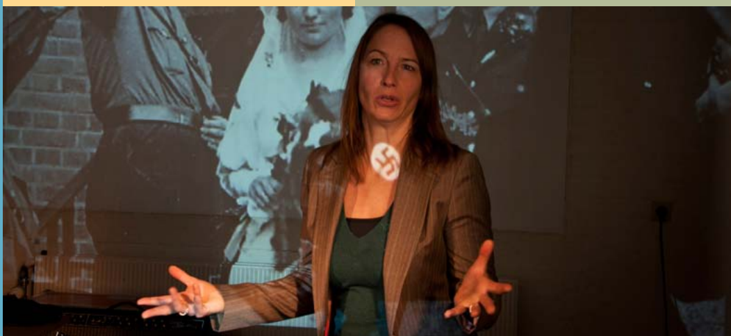
Voorstelling ‘Ik ben niet de oorlog’ ▲

Reserveren voor alle evenementen aanbevolen: 020 620 25 35 of lezingen@verzetsmuseum.org