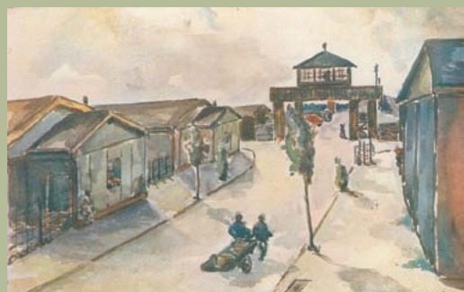
▲ Aquarel van Bob Entrop Sr. “Krijgsgevangenenkamp Mühldorf aan de Elbe”