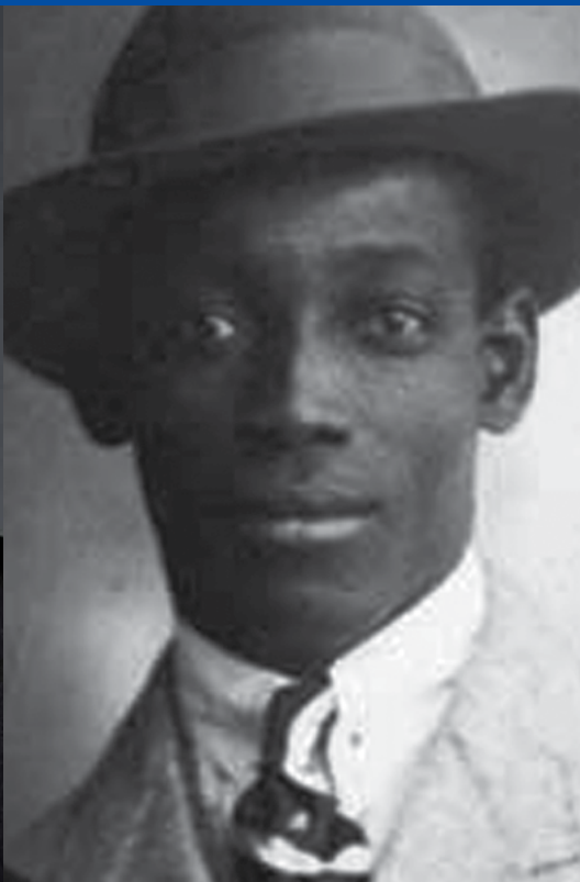
Anton de Kom