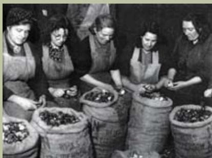
Het pellen van tulpenbollen voor de gaarkeuken in Rotterdam

DE TULPENBOL OP HET MENU T/M 16 NOVEMBER