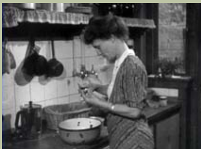
Huisvrouw in de keuken aan het werk

ZATERDAG 11 OKTOBER VRIENDENDAG speciale gast Paul van Vliet