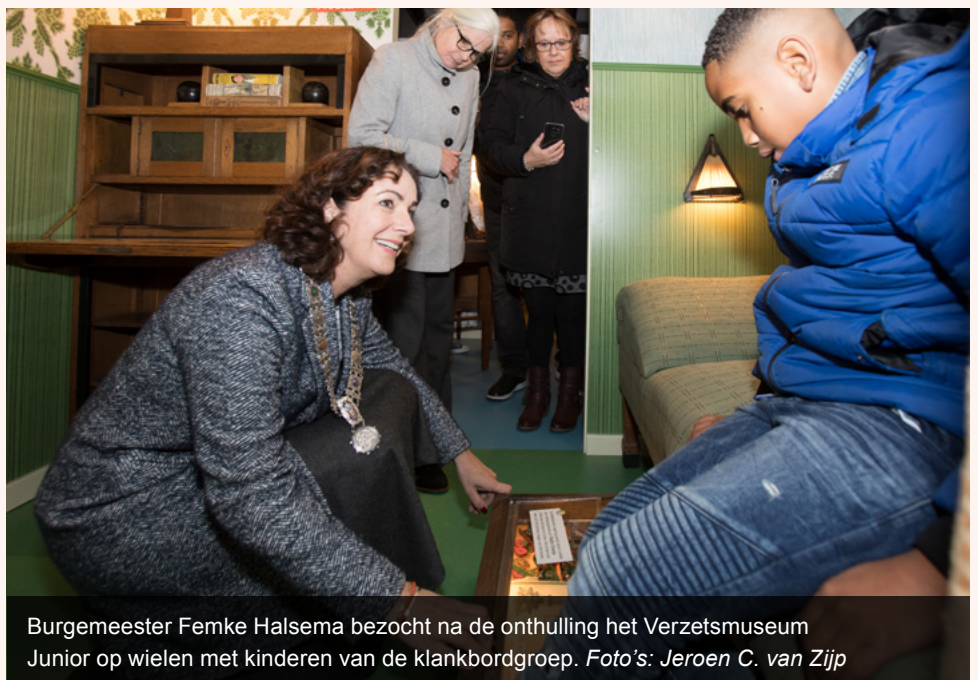
Burgemeester Femke Halsema bezoekt na de onthulling het Verzetsmuseum Junior op wielen met kinderen van de klankbordgroep.